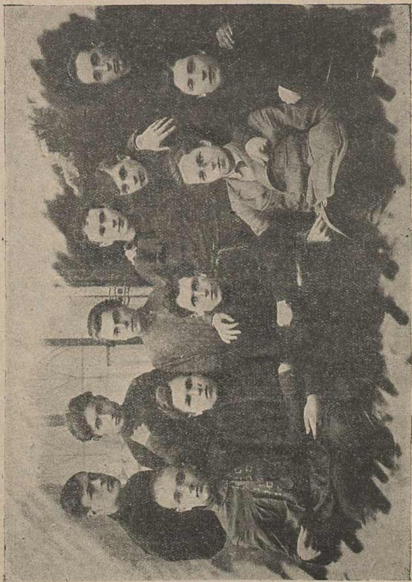
Ініціативна група, яка заснавала «Молодик».