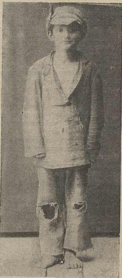
Бяспрытульны—дзіце беларускай вуліцы.

6. Узятася ЛКСМБ сатаварыства з комсамолам Заходняй Беларусі і Літвы павінна быць узмацнена праз аказаньне практычнай дапамогі тымі магчымасцямі, якія мы маем, жывучы ў