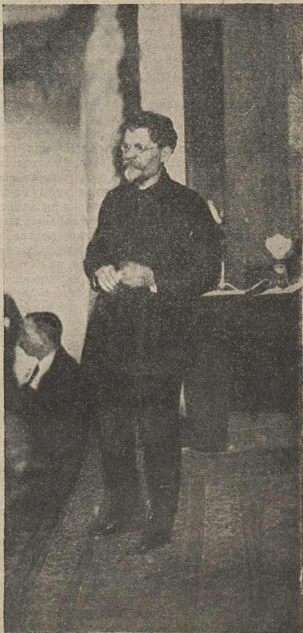
Калінін гаворыць прамову на 6-м (Надзвычайным) Зьездзе Саветаў БССР.

Перад Комуністычнаю Партыяй Беларусі, як перад арганізатарамі Савецкае улады разуж пасля вызваленьня Беларусі з-пад панскае окупацыі паўстала вялікае заданьне: загаіць глыбокія раны доўгагадовага разбурэньня і павясьці па шляху эканамічна-культурнага адра-